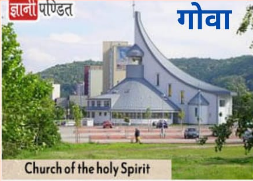
Church of the Holy Spirit