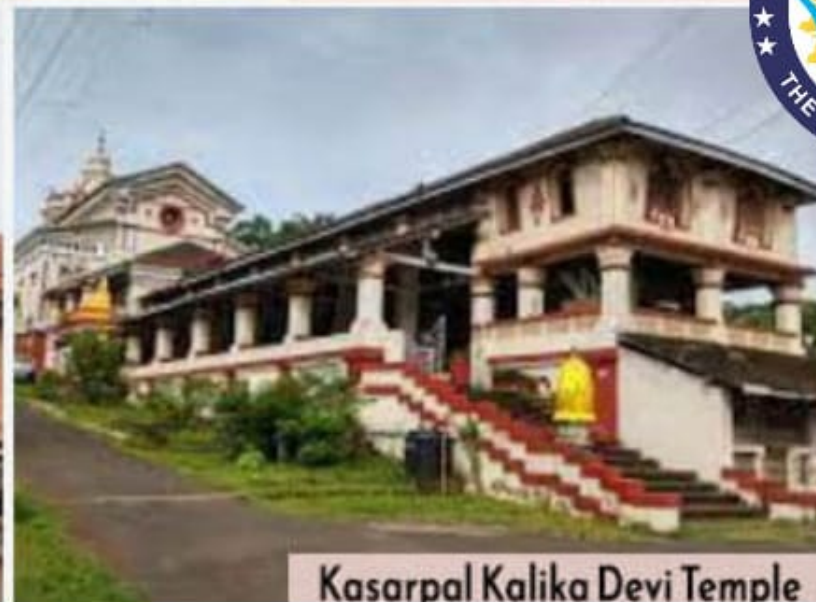
Kasarpal Kalika Devi Temple