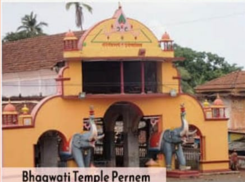
Bhagwati Temple Pernem