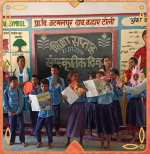
प्राथमिक विद्यालय जटमलपुर ढाब कहार टोली