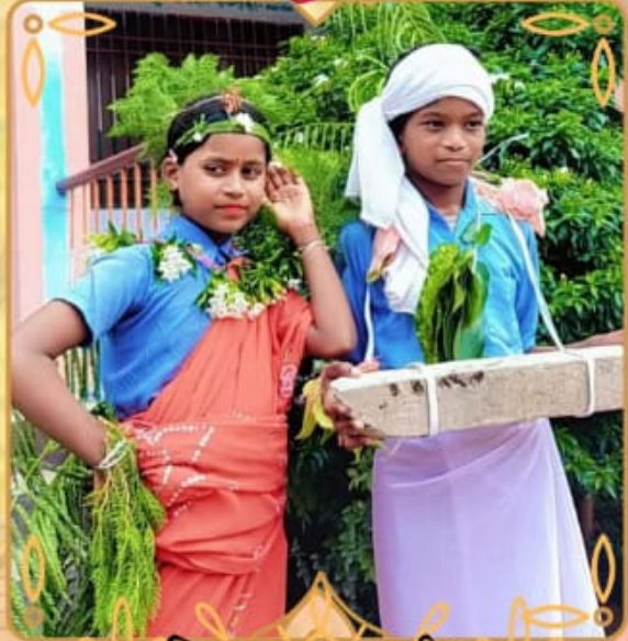
मध्य विद्यालय जगदीशपुर भागलपुर