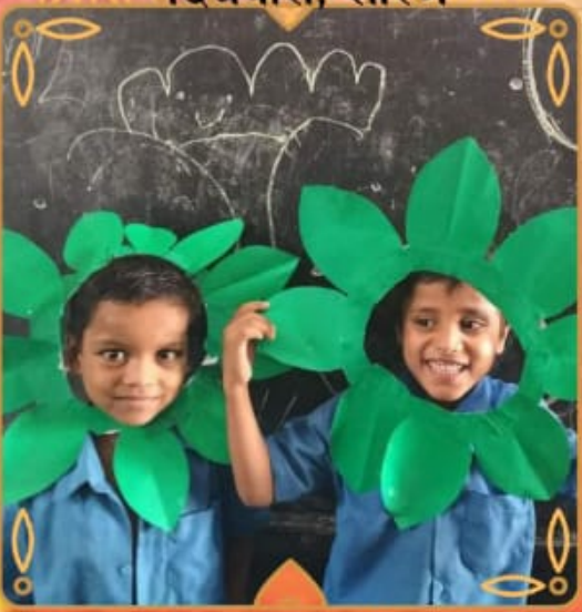
प्राथमिक विद्यालय प्रखंड कॉलोनी फुलवारीशरीफ पटना