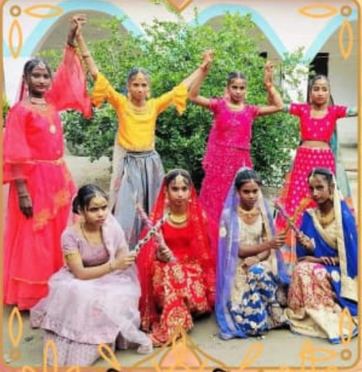
मध्य विद्यालय निजाचकम दिघवारा, सारण