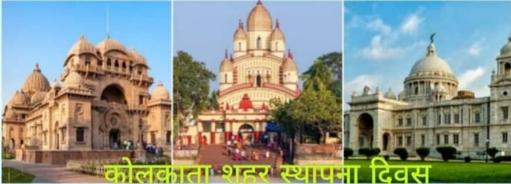
कोलकाता शहर स्थापना दिवस