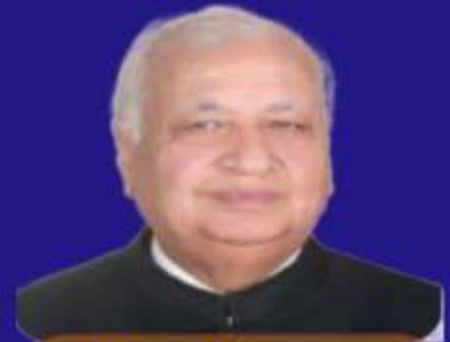
आरिफ़ मोहम्मद खान बिहार के राज्यपाल