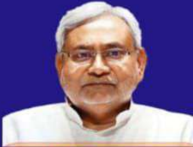
नीतीश कुमार बिहार के मुख्यमंत्री