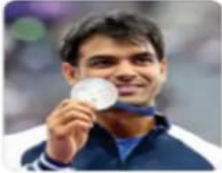
नीरज चोपड़ा सिल्वर