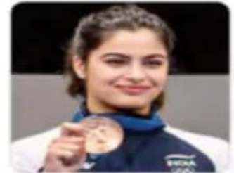
मनु भाकर ब्रॉन्ज