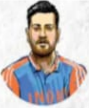
रोहित शर्मा (कप्तान)