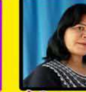
मेरी आडलीन पूना चम्पारण