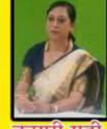
कुमारी गुडी किशनगर