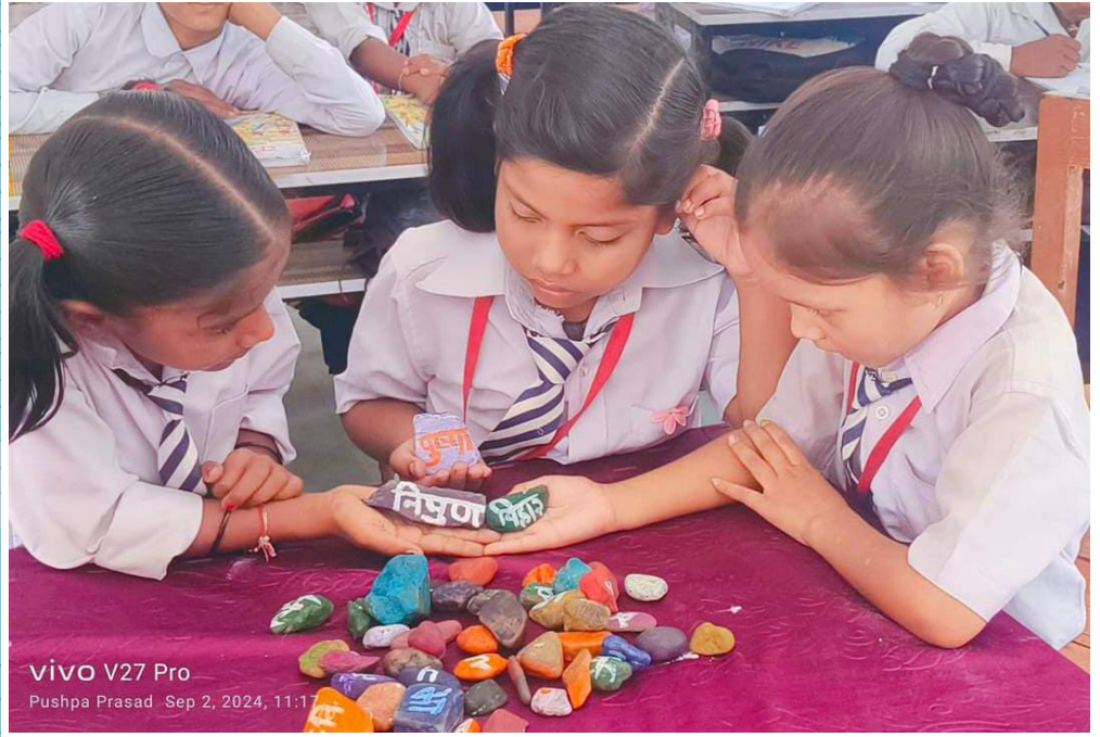
vivo V27 Pro Pushpa Prasad Sep 2, 2024, 11:11

6-7 तीज 16 हजरत मुहम्मद साहब जन्म दिवस 17 अनंत चतुर्दशी 25 जिउतिया