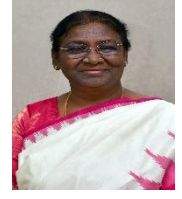
भारत के राष्ट्रपति: माननीय द्रौपदी मुर्मू

भारतीय सेना के तीन अंग हैं— थल सेना, नौ सेना और वायु सेना। भारतीय सेना के सुप्रीम कमांडर भारत के राष्ट्रपति होते हैं और उनके अधीन तीनों सेना के प्रमुख होते हैं। लेकिन वह अपनी शक्ति का उपयोग विधि के अनुसार ही कर सकते हैं। राष्ट्रपति अनुच्छेद 352 के तहत युद्ध या बाह्य आक्रमण या आंतरिक सशस्त्र विद्रोह की स्थिति में आपातकाल लागू कर सकता है।