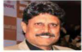
कपिल देव 2009