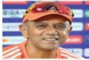
राहुल द्रविड़ 2018