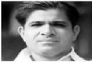
वीनू मांकड़ 2021