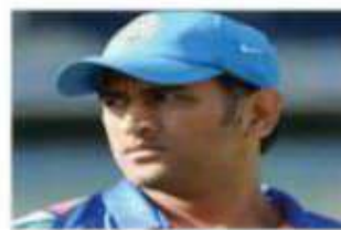
एमएस धोनी 2025