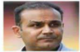
वीरेंद्र सहवाग 2023