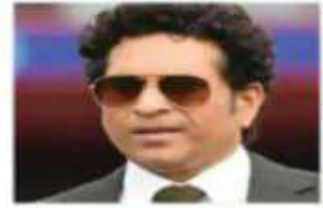
सचिन तेंदुलकर 2019