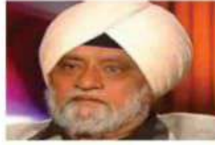
बिशन सिंह बेदी 2009