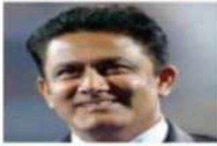
अनिल कुंबले 2015