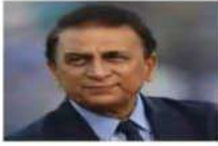
सुनील गावस्कर 2009